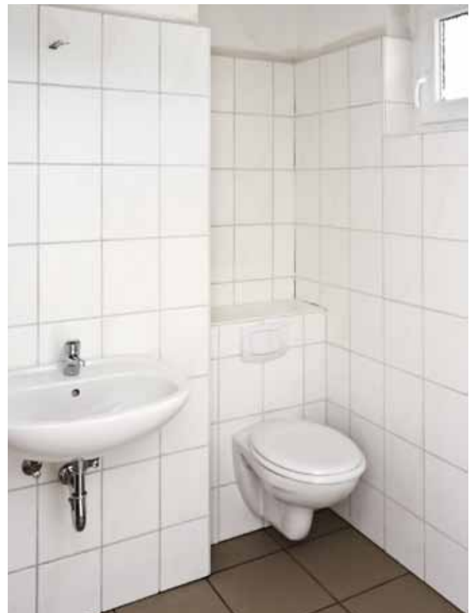
Bad, Ansicht 2