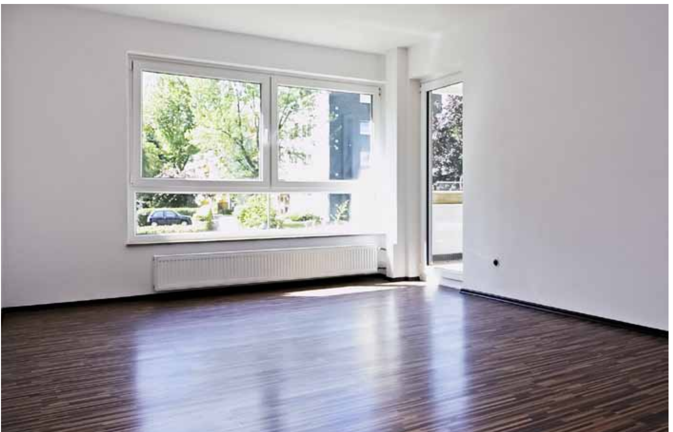
Wohnraum, Ansicht 1