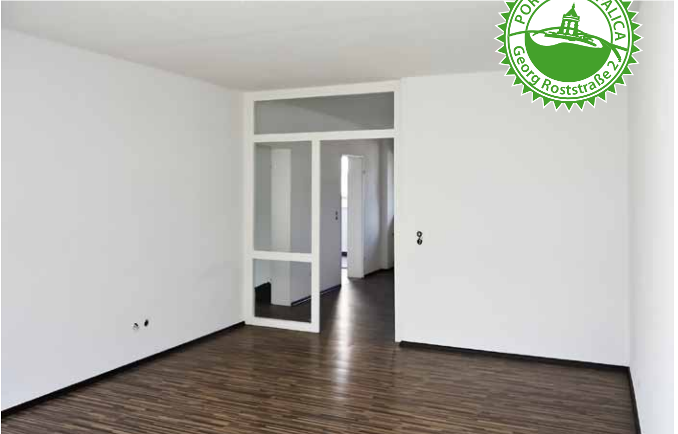
Wohnraum, Ansicht 2