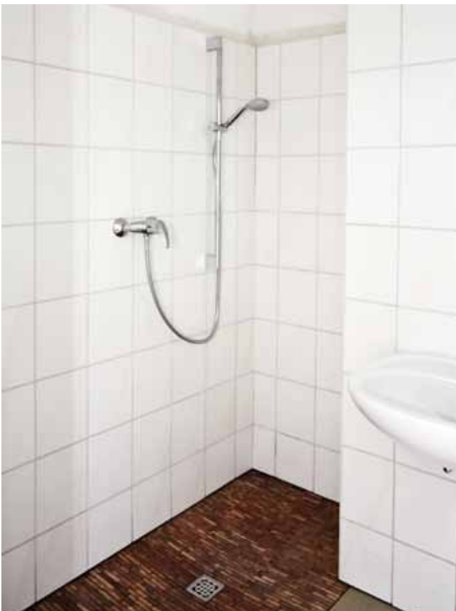
Bad, Ansicht 1