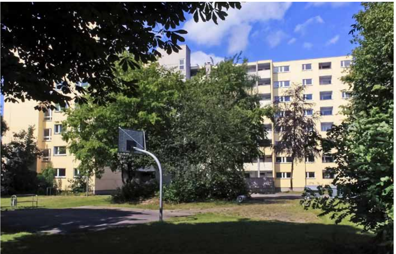
Mietobjekt Georg Roststraße 2, Etagen 1 bis 8