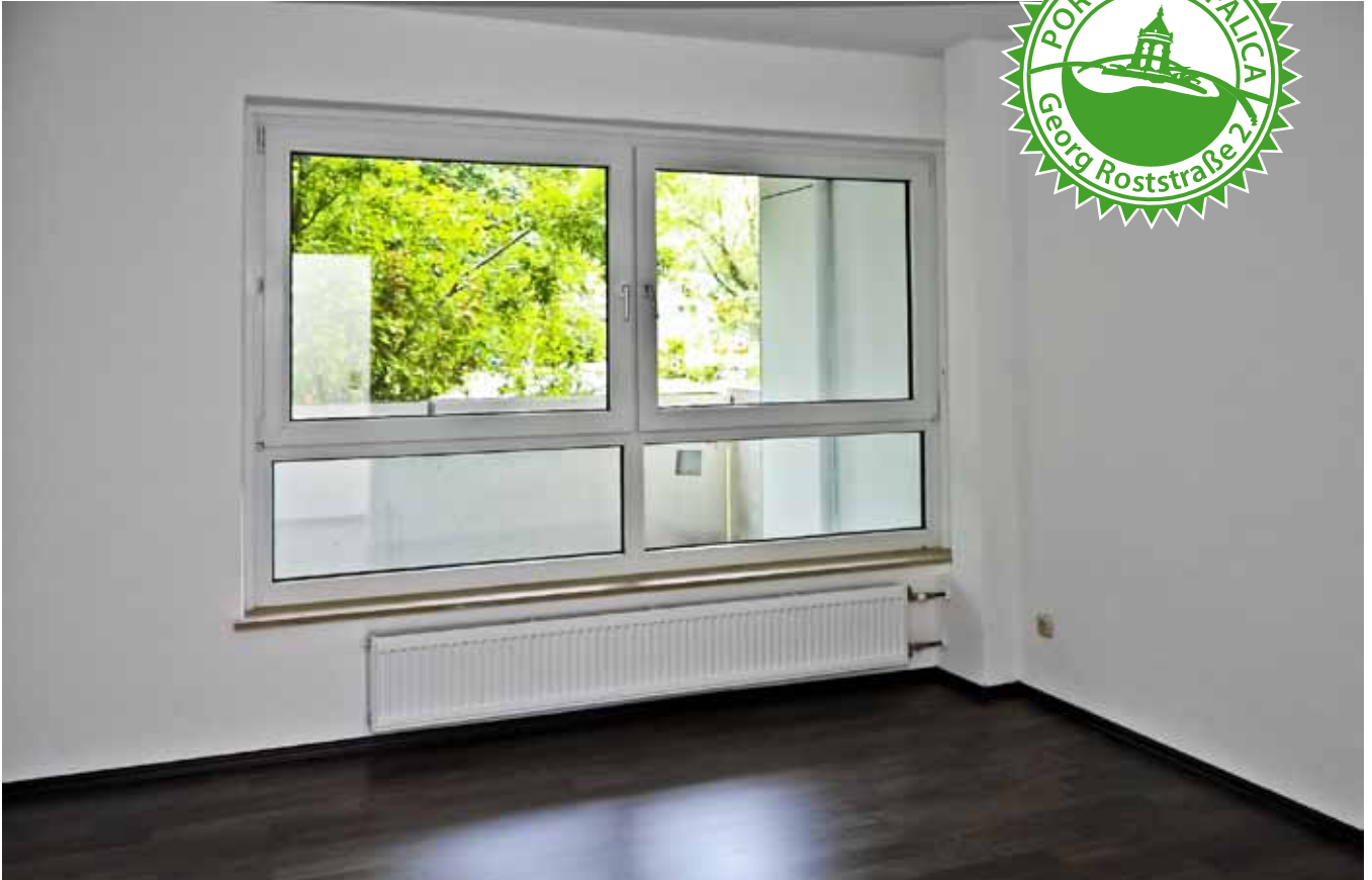
Schlafzimmer 1 / Eltern