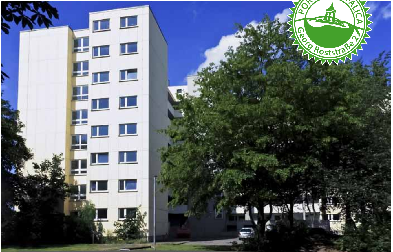
Mietobjekt Georg Roststraße 2, Etagen 1 bis 8, 4 Zimmer (93,45 qm)