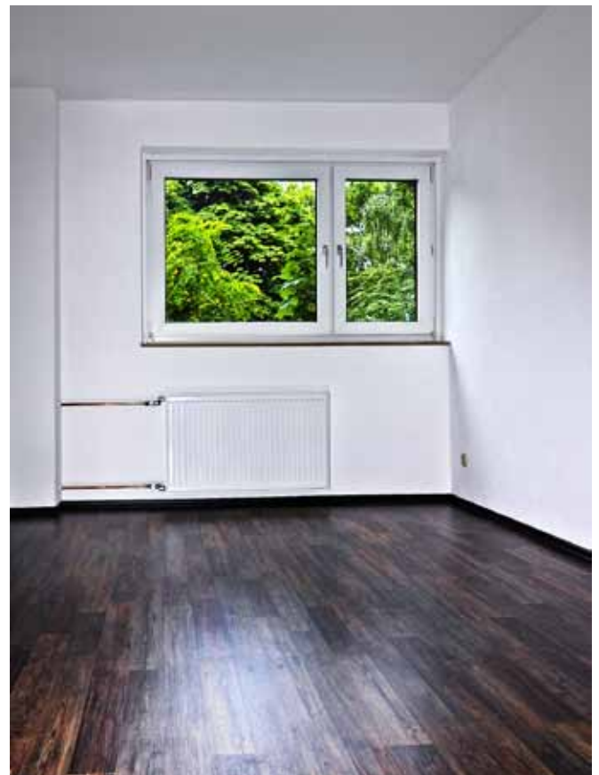
Schlafzimmer 3 / Kind 2