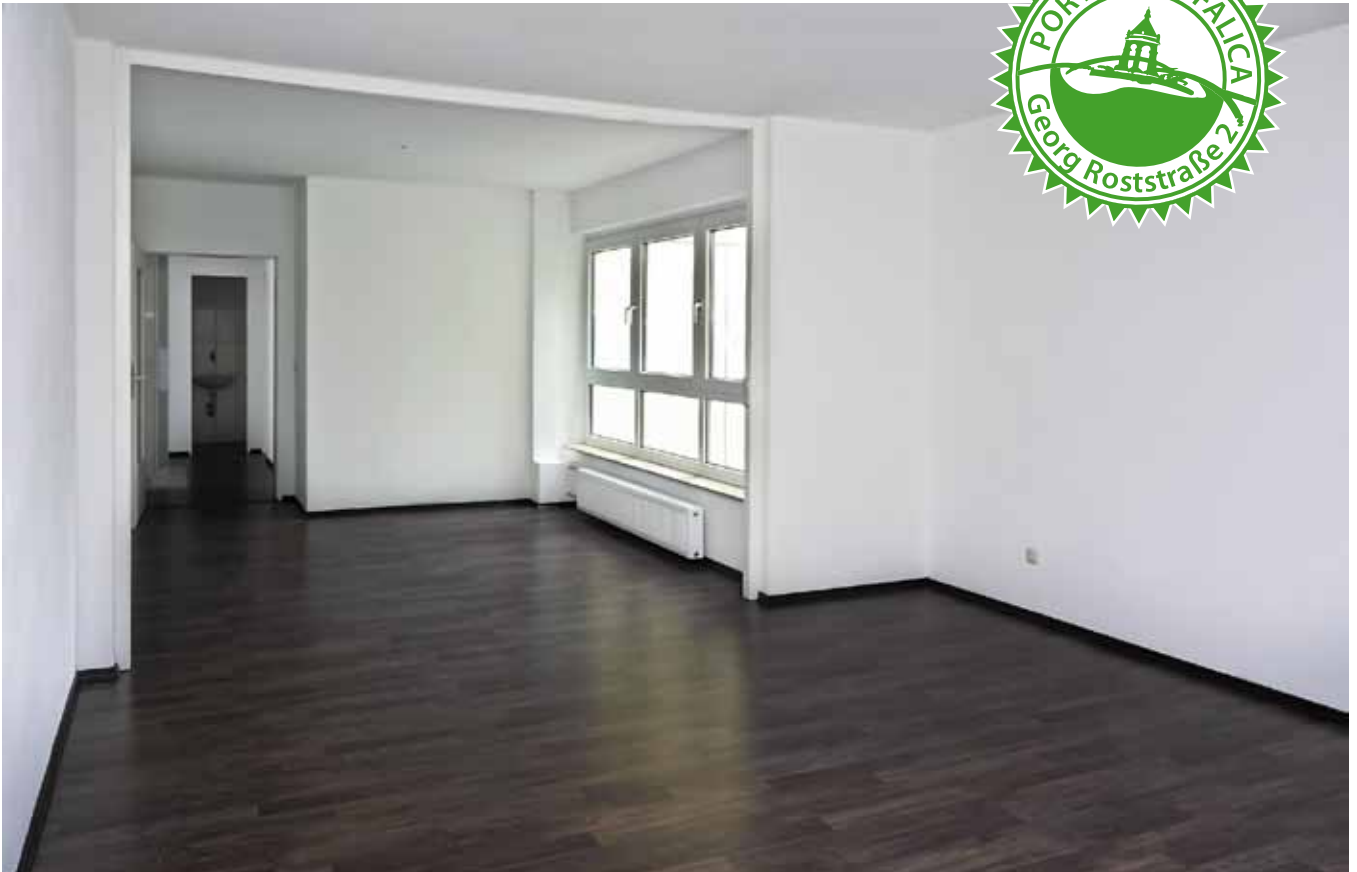
Diele / Essen