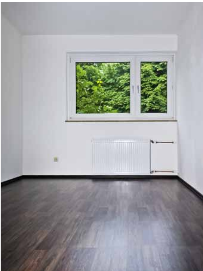
Schlafzimmer 2 / Kind 1